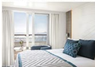
陽台艙 (3、4、5樓, 約 6.8坪)