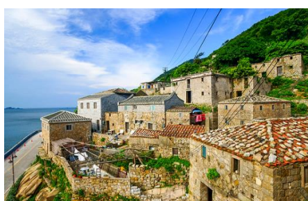
芹壁閩東古厝及愛情海