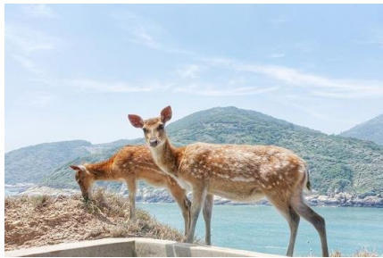
大坵島野生梅花鹿