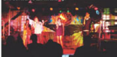
Live Band宛如小型美國會館High

要感受當地夜生活得乘車出了特區才能看到，離開崗哨後，馬上有種來到另一個世界的感受，當地人稱這裡叫做天使城。昔日美軍駐守的時候這裡可是夜夜笙歌，對照今日相形落寞，但仍可見些許觀光客流連，這裡最讓人臉紅心跳的是滿滿的酒吧，整條街隨處可見熱情的菲律賓辣妹搔首弄姿。領略了獨特風情後，在離街不遠處意外發現一間Live Band，現場除了可以回味英文老歌，偶爾也會唱些近代熱門歌曲，不禁要對菲律賓人天生的好歌喉讚美一番，樂團會適時與台下互動，氣氛活絡時客人還會奔向舞池跳舞，相較於「辣妹一條街」，這裡比較能讓人有放輕鬆的感受。