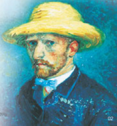
梵谷自畫像 (阿爾聖光馬 1874)