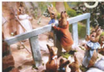
彼得兔電影聲名全球