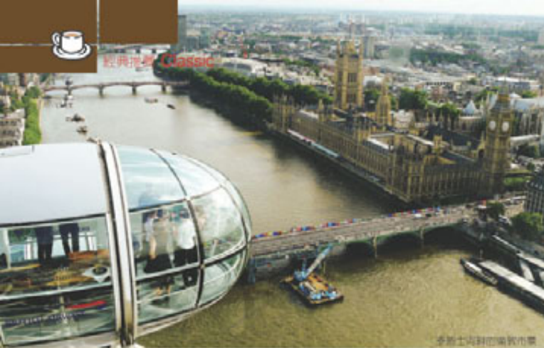
泰晤士河上的倫敦市景