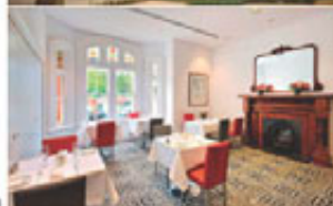
(圖為Seasons Heritage Hotel 內部)