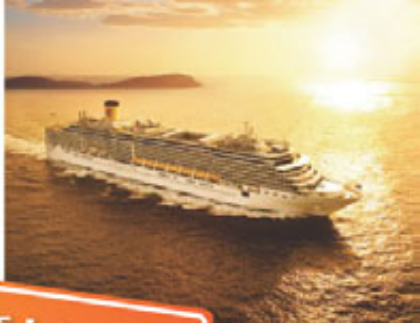
中世紀古城-愛沙尼亞塔林