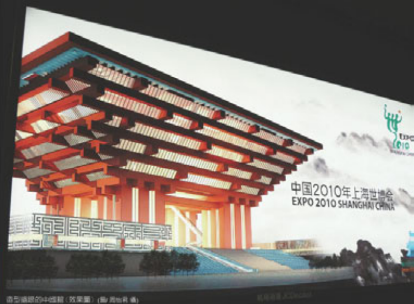
造型獨特的4號館（效果圖）