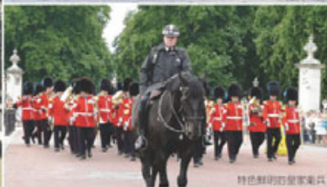
特色鮮明的皇家衛兵