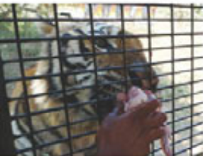
親老虎活動，非常刺激驚心

蘇比克的冒險之旅還沒結束，這裡有座隱藏在森林裡的動物園(Zoobic Safari)，最特別的就屬老虎園區，要進入開放式園區得換搭特製老虎車，出發前可跟園區人員買生雞肉，他們會跟上車協助餵食，僅隔著一道鐵網，近距離與老虎面對面，這種經歷也算少見。他們還會把