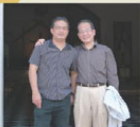
馬尼拉航空邀請菲律賓觀光部長 Reyes Iremeo(右)於16日蒞臨前往考察，行前特別有馬尼拉空服員多處精心策劃。