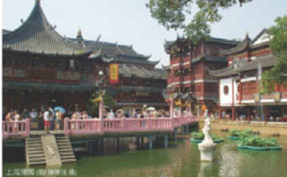
上海豫園