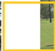
克拉克的熱帶入球場是距離台灣最近的專業級球場