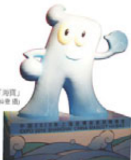
世博吉祥物「海寶」