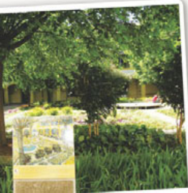
位於亞爾的聖雷米療養院

庫勒慕勒美術館以擁有《星空下的咖啡館》、《郵遞員》、《自畫像》等梵谷名作而倍受矚目，數量多達278件，當年創辦人海倫·庫勒穆勒夫人獨具慧眼，她是首批賞識梵谷並收藏其作品的伯樂之一，除了梵谷，館內還收藏有畢卡索、秀拉等名家的作品。能在一座森林裡遇見梵谷，感覺多了一份親切，與他的距離似乎更近了！🎨