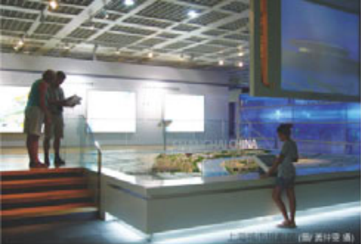
上海世博會館