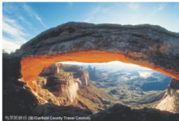
布萊斯峽谷

峽谷圓環中的布萊斯峽谷，有成千上萬個雕塑般的岩柱密密麻麻的聚在一起，這裡也是世界最大的粉紅色峽谷，隨著陽光移動，色彩瞬間變變變。另一個讓人不停仰角加廣角的還有錫安國家公園，刀削一般的高聳峽谷、風與沙合力畫成的棋盤山、橫跨天地間的大拱門等，每個岩石似乎都有自己的故事。