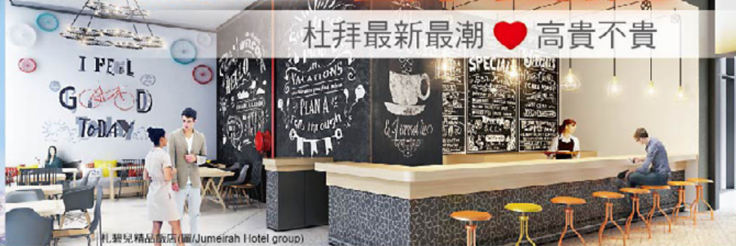
札碧兒精品飯店

為迎接2020年的杜拜世博會，以奢華酒店著稱的杜拜，不斷有新酒店開幕，一間間比奢華、比時尚，風格也更多元。其中最令人關注的就是帆船飯店集團旗下的年輕品牌「Zabeel House札碧兒，現代前衛的旅館設計，散發高檔的休閒氣息，有別於早期中東地區金光閃閃阿拉伯風格旅館，相當受到年輕族群的喜愛！