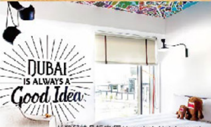
札碧兒精品飯店