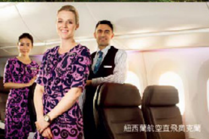
紐西蘭航空直飛奧克蘭