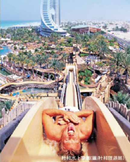
杜拜水上樂園