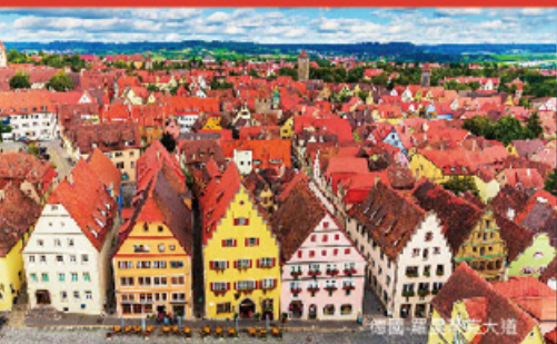
德國-羅曼蒂克大道