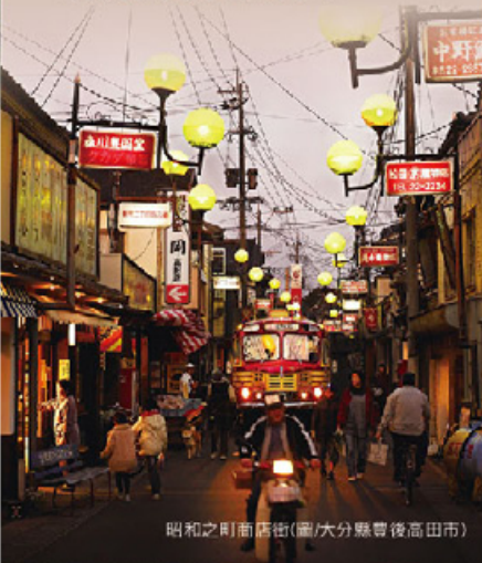
昭和之町商店街(圖/大分縣豐後高田市)

一封封穿越時空的信件 交織出一連串奇妙的事件 跨進昭和的傳說… 奇蹟就閃耀在平凡中！