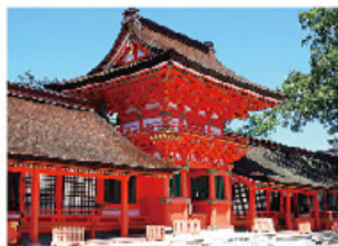
宇佐神宮

去年最具話題性的電影《解憂雜貨店》，改編自東野圭吾的催淚神作，拍攝地點就在九州大分縣的豐後高田市，這裡的「昭和之町」整條街保留著1950年代風味，每一家店都老的好新鮮，轉盤電話、黑膠唱片、老海報、漫畫書、木製老式冰箱、手搖式洗衣機、復古車輛等，還有琳琅滿目的懷舊零食可以買…短短550公尺的街區，就像走進時光隧道，可以摸到時間的流動的觸感，而影帝西田敏行詮釋的溫暖故事，更讓這個老街增添無限的感動！