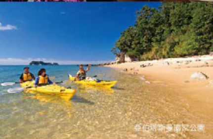
亞伯塔斯曼國家公園