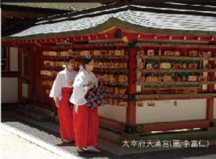
太宰府天滿宮