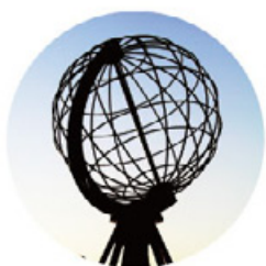
北歐遊獵帝王蟹