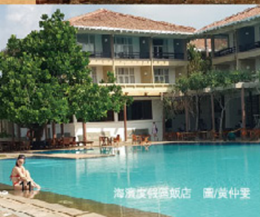
海濱度假飯店