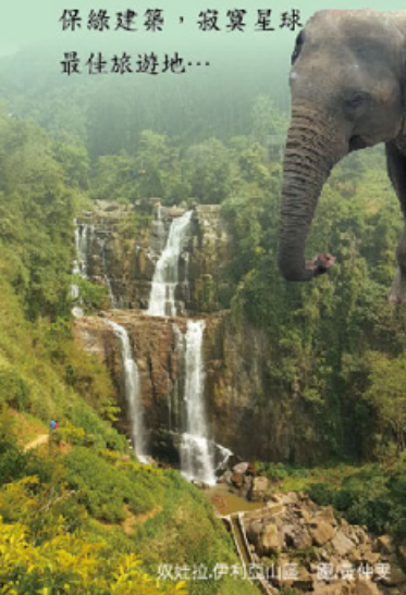
奴拉拉·伊利亞山區 圖/黃仲雯