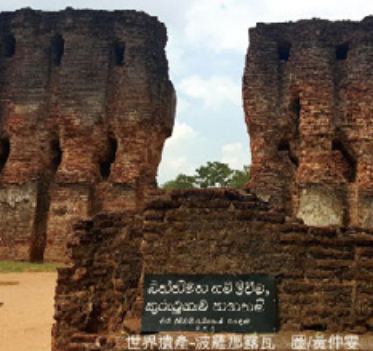
世界遺產-波羅那露瓦