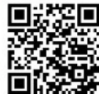
旅遊講座線上報名

地點：鳳凰旅遊台北總公司 台北市長安東路一段25號5樓 報名專線：(02)2537-8221、(02)2537-8193