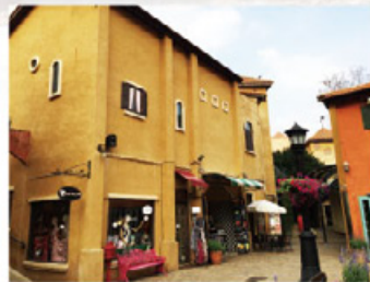
Palio 小義大利鎮

全前往泰國旅遊，玩膩了曼谷、清邁、普吉島嗎？想要感受深度、放鬆的山林之旅又不想舟車勞頓，不妨可以前往距離曼谷約兩小時車程的大城府與考艾這兩個地方走走。