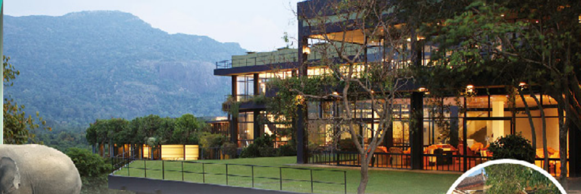
Kandalama Hotel 五星環保綠建築得獎飯店