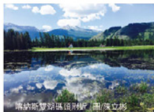
喀納斯湖湖區別墅

還有一個則屬於玩家級的路線，特別搭乘3人一台的越野車穿越天山公路(獨庫公路)，公路費時10年才修建完成，由於地勢與氣候因素，只在6月到9月才開放通行且不能行走大巴，一路上可飽覽天山南北不同的風貌，相當過癮。