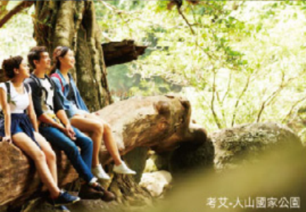
考艾-大山國家公園