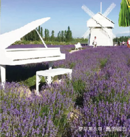
伊犁薰衣草