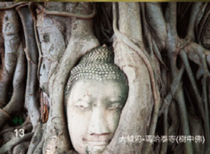
大城府-瑪哈泰寺(樹中佛)