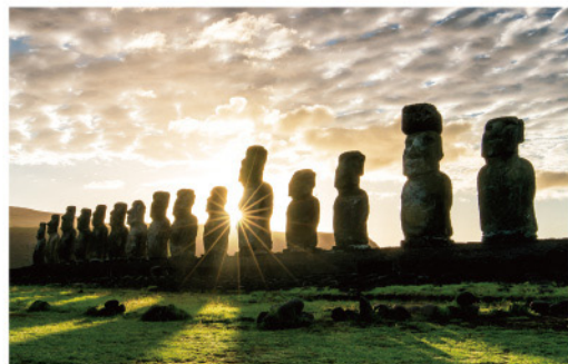
日出及日落都是拍攝摩艾的絕佳時機

看到摩艾，絕對會特別興奮而且不停拍照，一定要拍的畫面就是日出時太陽緩緩從海平面升起，從摩艾與摩艾之間透出的光芒，以及日落夕陽下摩艾拉長的影子，不但更唯美，而且都好有戲的感覺！