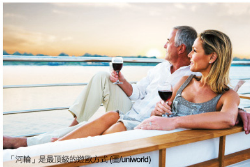
「河輪」是最頂級的遊歐方式

阿姆斯特丹也是全球知名的港口城市，是五星歐洲河輪UNIWorld的重點港口，「河輪」是公認最頂級的遊歐方式，鳳凰河輪之旅將邀您登上River Empress，由阿姆斯特丹出發，沿著萊茵河直探歐洲唯美浪漫。