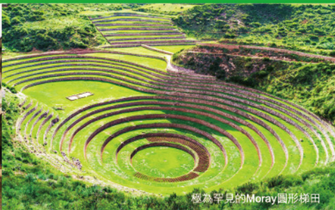
極為罕見的Moray圓形梯田