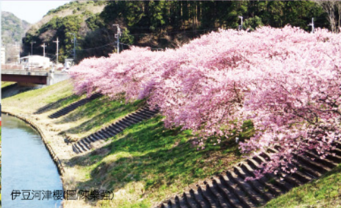
伊豆河津櫻