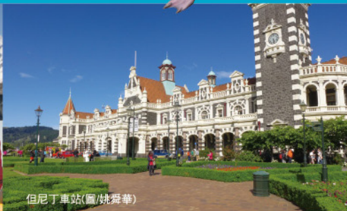
但尼丁車站