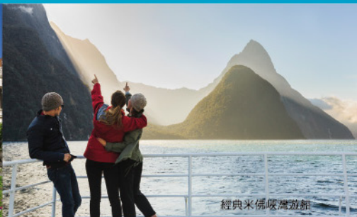
經典米佛峽灣遊船