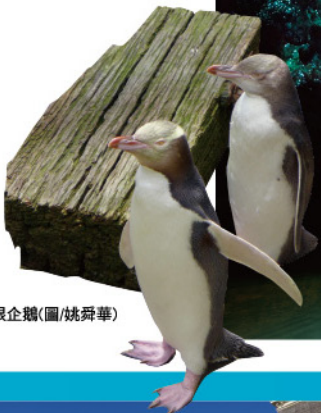
黃眼企鵝

除了天然景觀外，紐西蘭的生態也頗有看頭，搭乘小船前進第阿納螢火蟲洞，仰望觀看洞穴中的滿天星光，或是走訪海岸邊特殊建造的壕溝，進距離觀察黃眼企鵝的生態活動，都是不錯的選擇。若想要來點刺激的內容，也可走訪電影魔戒場景中安都因河的取景地-懷奧河，利用噴射快艇體驗原始的河道和森林美景，再搭乘Land Rover陸虎四驅車深入瓦納卡湖畔小徑。