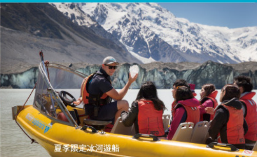
夏季限定冰河遊船