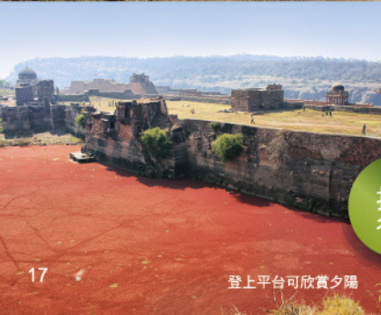
登上平台可欣賞夕陽