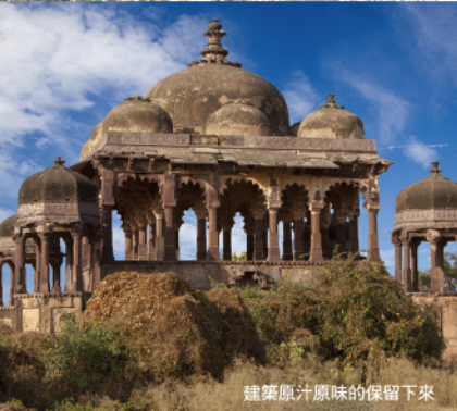
建築原汁原味的保留下來