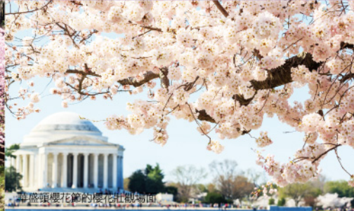
華盛頓櫻花節的櫻花壯觀場面