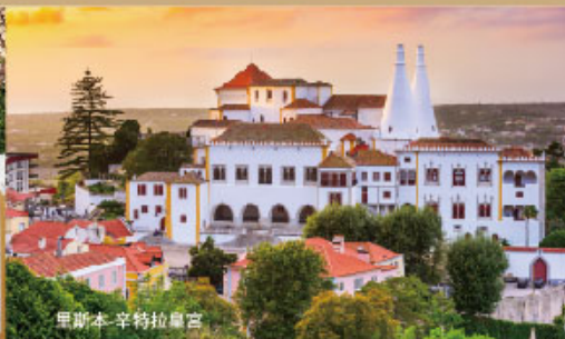
里斯本 辛特拉皇宮