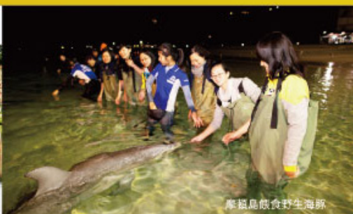
摩頓島餵食野生海豚