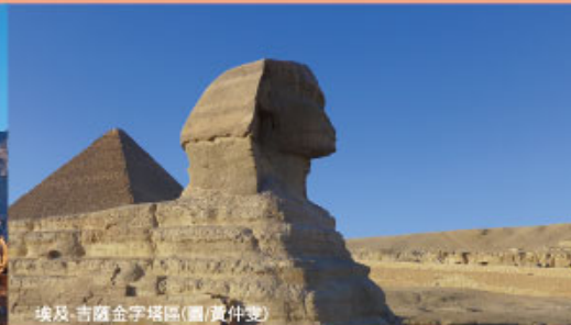
埃及.吉薩金字塔區