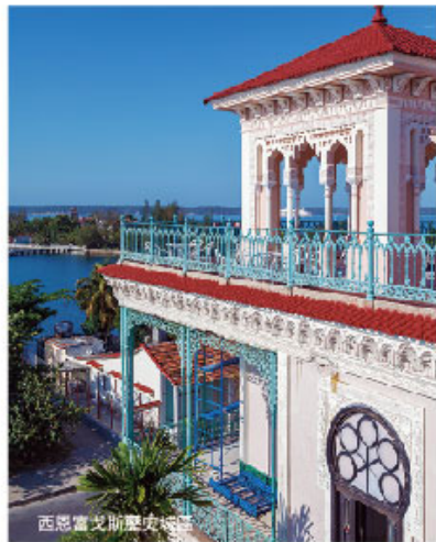
西恩富戈斯歷史城區

歷經53年的經濟制裁，美國與古巴的關係終於破冰了，旅遊也迎來了大解禁，今年總統出國訪問，總統專機就直接取道古巴領空，古巴儼然已成為最火紅的旅遊國度。滿街古董車、叨著雪茄的老人、拉丁色彩的小巷弄，是許多人迷戀上古巴的原因，隨著開放的變遷，這份古味勢必會逐漸消失，想去的話真的要趁早！