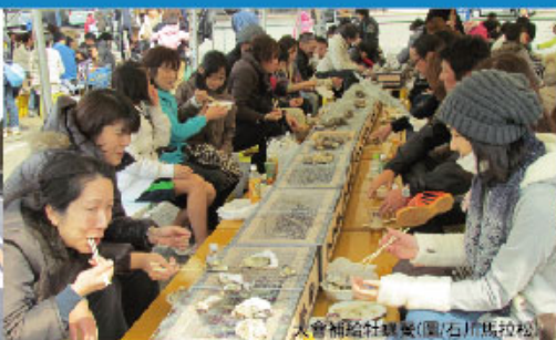
大會補給站