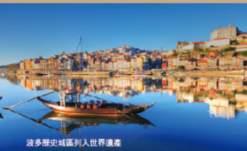
波多歷史城區列入世界遺產