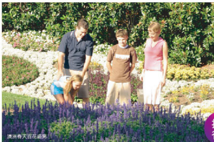
澳洲春天百花盛開

西澳屬於陽光普照的地中海型氣候，藍海與潔白沙灘是歐美旅客最愛的度假勝地，這裡除了能感受澳洲Life Style的悠閒氛圍，因即將到來的春季，9~11月間沿途都能發現盛開的野花，位於柏斯的英皇公園，9月起更會舉辦為期一個月的野花節，除了有美麗的花海外還有相關的音樂活動非常熱鬧，另外可造訪世界知名瑪格麗特河酒鄉區，品嚐酒莊的葡萄酒，為旅程留下微醺的記憶，有美酒當然不能錯過美食，走一趟松露農莊，享用奢華的松露料理吧！