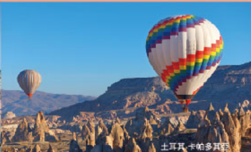
土耳其.卡帕多其亞