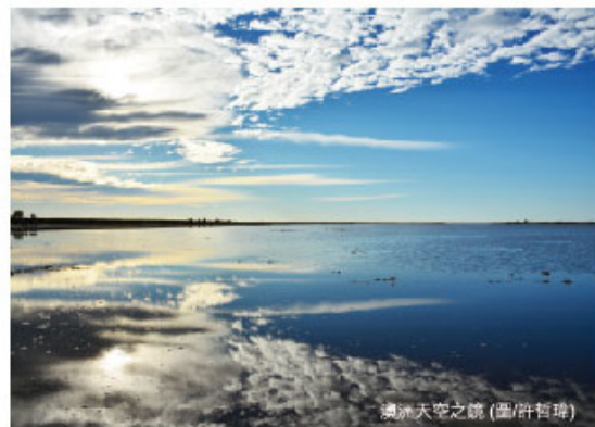
澳洲天空之境