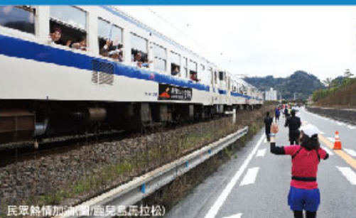
民眾熱情加油(圖/鹿兒島馬拉松)

提到日本九州的早春路跑，非每年一月的第二個星期日舉辦的指宿馬拉松莫屬，這場路跑除了能沿途欣賞金黃油菜花海外，還能品嚐蒸紅薯和紅豆沙，不僅志願者多達2000人，路邊的加油團和補給站更是款待十足，不愧是日本最早公認的市民馬拉松賽事。接續著3月份還有鹿兒島馬拉松，沿途可見海中美麗的櫻島火山，賽程途中更不乏當地美味的特產薩摩芋和蜜柑、漬物等，完全不用擔心補充體力的飲料或食物。