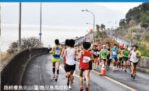
跑經櫻島火山(圖/鹿兒島馬拉松)