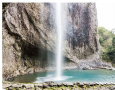
天下第一瀑-大龍湫

地質結構形成於白堊紀的火山噴發時期，距今約有1.2億年，屬流紋岩，因此又有流紋質天然博物館之稱，隨便取個角度都能拍出山靈水秀的意境，難怪許多武俠劇特別喜歡在此取景。