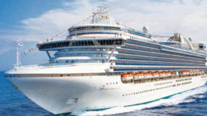
文/林凡瑄 圖/公主遊輪

遊輪假期可說是全年齡都適合參加的旅遊行程，在船上可以放空做日光浴，也能到泳池邊曬曬比基尼，餐廳buffet無限美食/飲品任選，若想換口味，另有加價的美味龍蝦餐&牛排餐，靠岸後隨意安排岸上觀光，回船後還有更多船上活動等著你，夜間替自己安排一場歌舞劇，或欣賞一部露天電影，船上也能來點調酒，幫夜晚加分。省去每日搬行李換房間的困擾，一醒來就抵達日本沖繩、石垣島等地，想要shopping也沒有行李限重，最重要的是在基隆上下船超方便，遊輪行程等你來體驗！