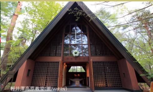
輕井澤高原教堂