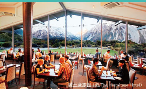
隱士蘆旅館