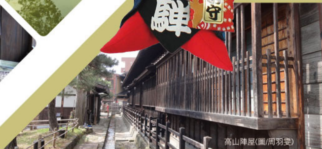
高山陣屋