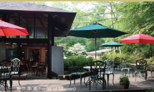
輕井澤(圖/Forest of Museum)

此外，同樣是東京近郊、位在長野縣東部的輕井澤，則是日本著名的避暑勝地，擁有優美的森林搭配古典教堂建築、庭園、湖泊及完善的步道，像是男女最憧憬的婚禮舉辦地~聖保羅教堂、舊三笠賓館等古典摩登建築、天鵝湖美稱的雲場池等皆不容錯過。遊輕井澤最自在的方式，就是租一輛自行車，享受拂面而來的清風及怡人景致，也可以體驗高爾夫、騎馬、滑雪等活動，或在輕井澤銀座盡情購物。