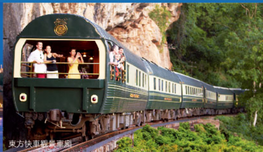
東方快車鐵道車廂