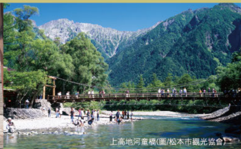
上高地河童橋