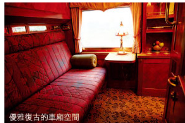
優雅復古的車廂空間