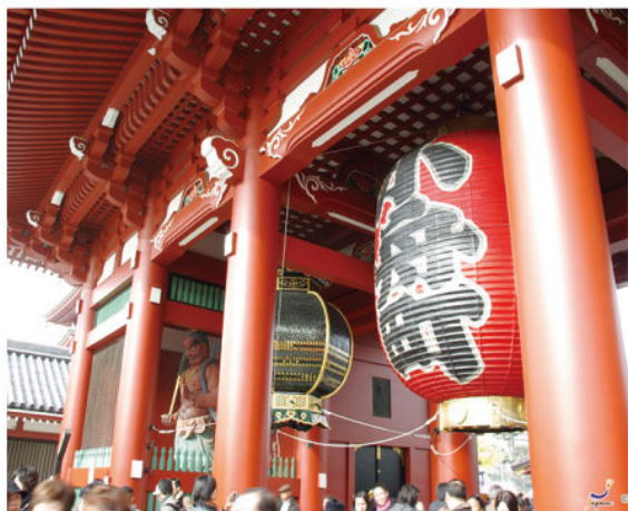
東京淺草寺

首爾5天的小團旅行同樣也有五條旅遊路線讓遊客自由選擇，包含了景福宮路線、逛街血拼路線以及南怡島和小法國村等。