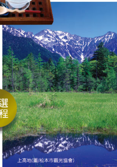
上高地(圖/松本市觀光協會)