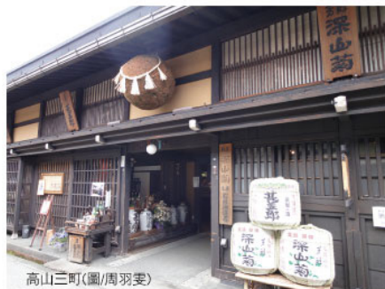
高山三町(圖/周羽雯)

離，偶有野鴨、獼猴玩耍其間。而上高地的象徵則是梓川上的河童橋，它是一座木製吊橋，站在橋上眼前就是並排聳立的穗高連峰，還有松林間的梓川風景，等於是座絕佳的眺望台，梓川的水即使在夏天也是沁涼透心！