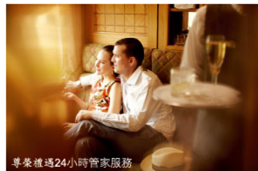
尊榮禮遇24小時管家服務