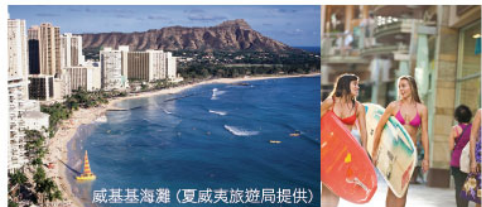
威基基海灘

夏威夷也推出小團旅行囉！除了保有自由活動的時間，更安排古蘭尼牧場全日暢遊、黃昏愛之船之旅(含牛排+大王蟹晚餐)、珍珠港、小環島精華遊以及鑽石頭山健行一覽歐胡島風光。此外夏威夷也是購物天堂，不論是卡拉卡瓦大道的名品街購物，或是ALA MOANA MALL，都可滿足購物樂趣。