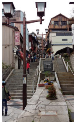
伊香保石段階