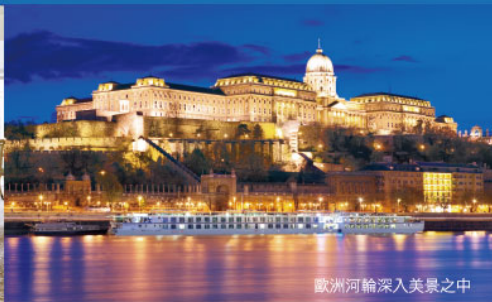
歐洲河輪深入美景之中