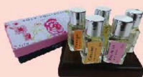
法國香水名城格拉斯 FRAGONARD 香水組