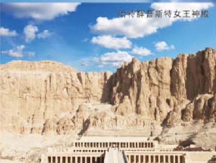
哈特謝普蘇特女王神殿