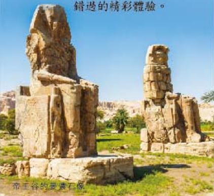
帝王谷的 Amenhotep III

對於這個始終保持神秘的國度-埃及，大多數人都還停留在金字塔與沙漠的駱駝商隊印象中，其實埃及絕非僅有古蹟建築物與法老們的欣賞，尼羅河與紅海一帶的美景也都是不能錯過的精彩體驗。