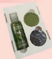
法國普羅旺斯「一顆橄欖」 美風輕巧旅行組