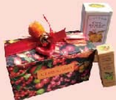
義大利普莉歐 L'ERBOLARIO 草本香氛護理組