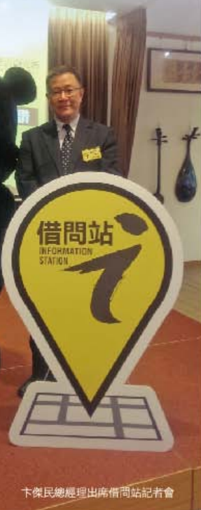
卡傑民總經理出席借問站記者會