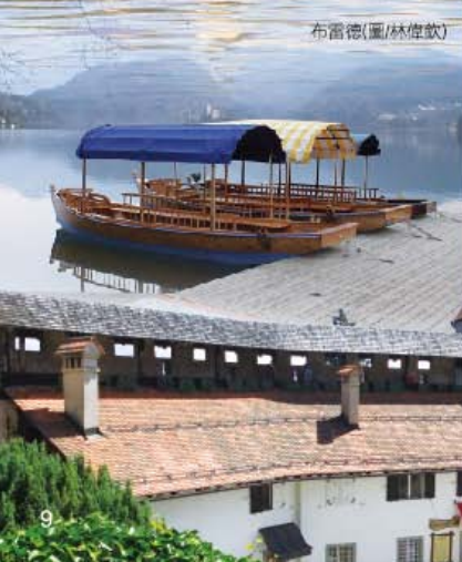
布雷德城堡