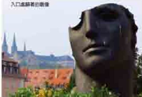
入口處靜著的雕像