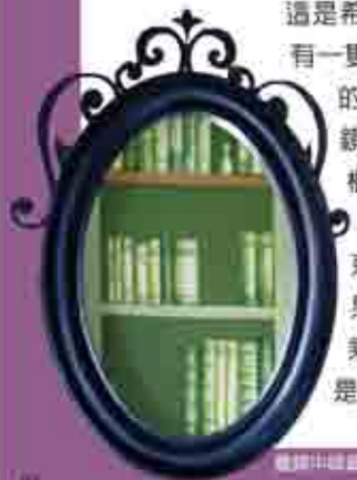
魔鏡中隱藏玄機，與小魔女

日本續假期間1/20-2/10小朋友優惠！ 2-4歲不佔床減1萬元，5-12歲不佔床減8千元(團體機票不適用,不得與其他優惠合併)