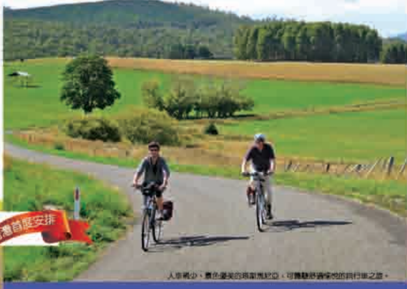
人車稀少、景色優美的塔斯馬尼亞，可體驗舒適慢性的自行車之旅。

電影《練習曲》中說：「騎腳踏車總是能看 到最好的風景的一面。」那種自在穿梭的速 度，很自然的就把我們帶到地球上某個動人的 角落。體驗過單車旅行的人應該會認同：人，加 上一台腳踏車，就是最適合旅行的那套。」