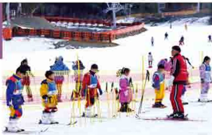
到韓國學習滑雪及比賽，是寒假相當熱門的活動

韓國冬季最具代表性的活動Fun Ski & Snow Festival，今年首度在江原道HIGH 1飯店舉辦，這項融合了滑雪課程、休閒娛樂、派對、韓國傳統遊藝、料理等的熱門觀光活動，全亞洲僅提供200個名額，台灣區由鳳凰旅遊獨家代理，機會非常難能可貴！