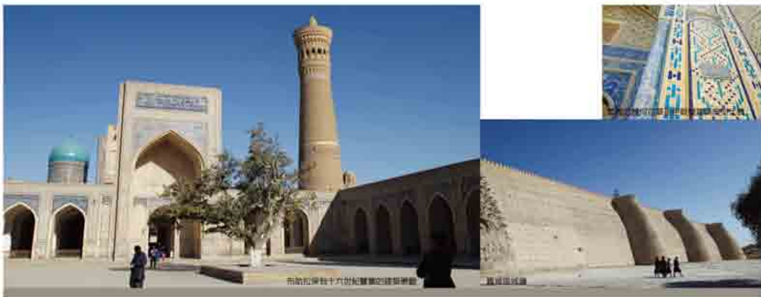
布哈拉保留十六世紀建築的建築景觀