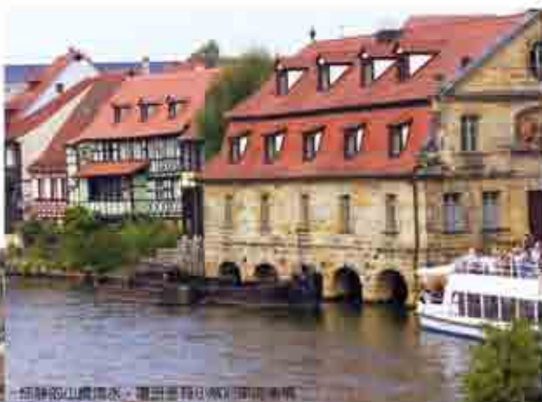
恬靜的山巒流水，讓這座有900年歷史的古城