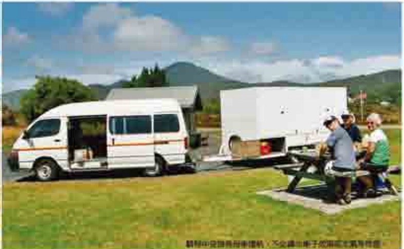
騎車中從馬尼拉/墨爾本/台北 提供