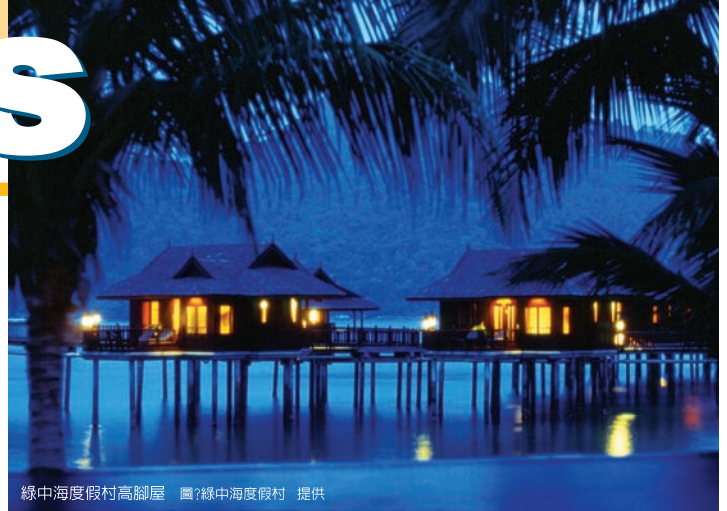
綠中海度假村高腳屋

擁有長達五公里的細白沙灘與清澈透明的海水相伴，使得這裡水上活動十分盛行，除了一般的香蕉船、風帆船設施，還可以選擇海釣或浮潛活動，更有高爾夫球場可以讓旅客盡情揮杆，傍晚夕陽西下漫步潔白沙灘上，還能感受另一種浪漫恬靜的氣氛，是所有到訪過的旅客一致推薦的沙灘體驗。