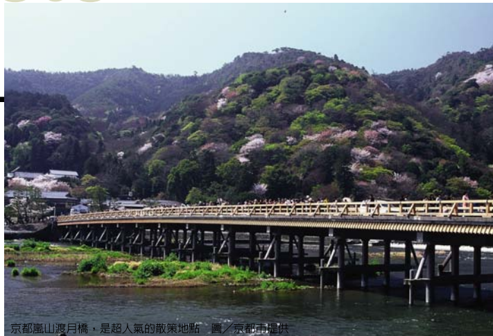
京都嵐山渡月橋，是超人氣的散策地點。

京都最有名的藝伎區，也是日本規格最高的繁華街，平常藝伎就在這裡生活，又稱為花街。夠幸運的話，可遇見從茶屋裡出來的藝伎，不過立刻會上演眾人拿著相機追逐的畫面，街上林立著料亭、甜點屋以及賣髮簪、包包、唇膏等藝伎專用小物的店。