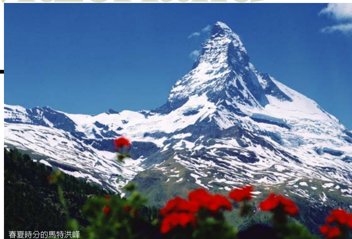
春夏時分的馬特洪峰

第二條經典旅遊路線，當然非少女峰莫屬，少女峰有「歐洲屋脊」的美譽，自古以來受到觀光客的青睞，更被列名為世界自然遺產。從勞特布魯能搭高山火車登上海拔3454公尺的少女峰車站，途中行經層層山巒，儀象萬千的奇景，處處皆是鏡頭下的故事。