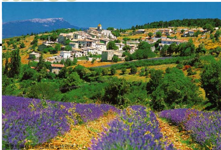
夏季的普羅旺斯田園風光特別迷人。

印象派大師-梵谷在亞爾居住長達2年之久，這段時間的作品被認為創作巔峰期。漫步這座歷史古城，特別讓人興起懷舊念頭，轉進巷弄裡可見梵谷著名畫作「星空下的咖啡館」實景，還有梵谷住過的療養院、競技場等都能看到其畫作蹤跡，可謂一趟歷史與藝術的饗宴。