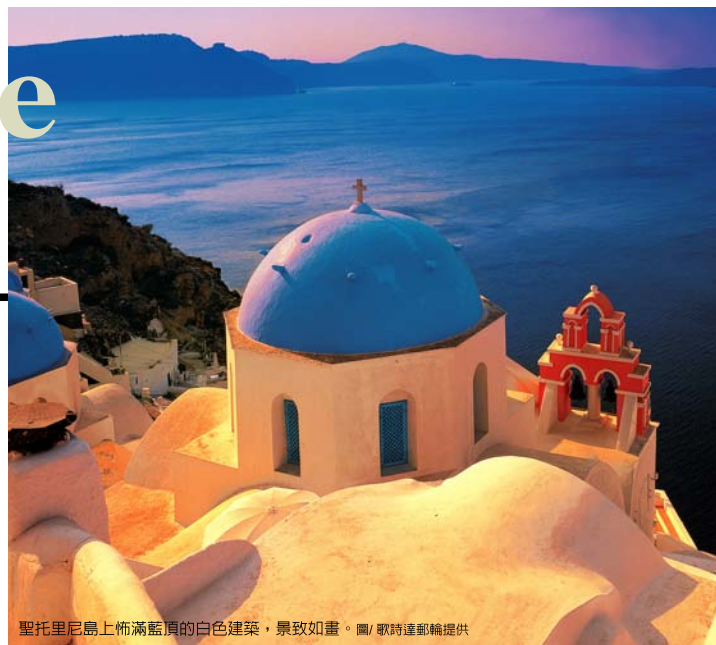
聖托里尼島上佈滿藍頂的白色建築，景致如畫。

說到夕陽，聖托里尼島的伊亞落日，號稱是「世界最美的夕陽」，每到黃昏，斷崖上就會出現人潮，全