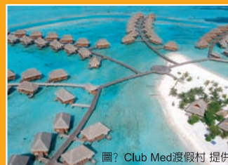
圖? Club Med渡假村 提供

在 Club Med 度假村裡，你可以盡情享受村內規劃的所有水陸活動設施，舒適的住宿環境、 SPA 村多項療程服務、無限享用的吧台飲品以及豐盛的異國美食，甚至有村外旅遊的規劃安排。