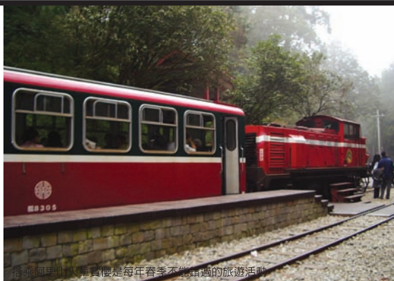
搭乘阿里山小火車是每年春季不能錯過的旅遊活動

阿里山火車另一個熱門站就是奮起湖，當然，最有意思的還是逛百年老街，穿梭在窄窄的巷弄間尋寶，延續古法製作的鐵路便當是這裡的招牌特產，散發著檜木香的便當盒，裡面裝滿了傳統的好味道，很適合大口大口的扒進嘴裡。另外，像烙印有火車圖樣的火車餅，都市人很難得吃到的野生愛玉子，以及草ㄚ粿、公婆餅等，完全體驗台灣人最喜愛的玩法：一路吃、一路玩哦。