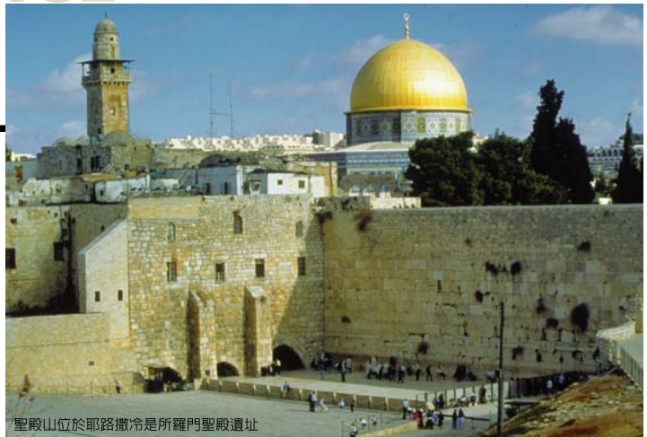
聖殿山位於耶路撒冷是所羅門聖殿遺址

死海又名鹽海，是世界上鹽度最高、礦物質最豐富的水域，任何生物都無法生存，不過蘊含豐富的礦物質成分，倒是對皮膚病患者有神奇療效。埃及豔后時代起，更因發現美容功效而聞名全球，這裡最受青睞的活動莫過於浮游死海之上，到此一定要親身感受這項奇特體驗。