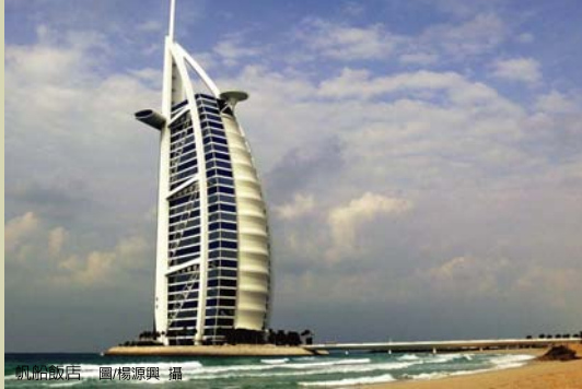
帆船飯店