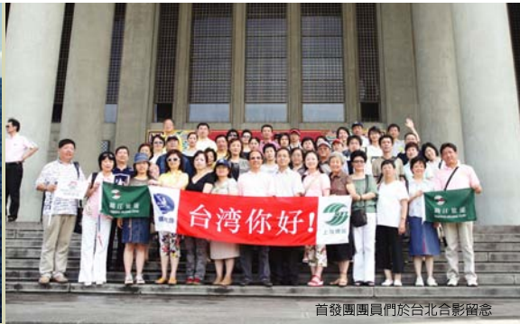
首發團團員們於台北合影留念