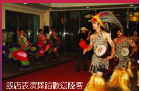
飯店表演舞蹈歡迎陸客

在住宿方面，鳳凰旅遊全程安排高規格接待～花蓮遠雄悅來、高雄漢來、墾丁福華、台東知本老爺、嘉義耐斯王子、日月潭汎麗雅、台北的遠東國際、圓山飯店，十天下來每天都是高檔禮遇，不論是飯店、餐廳、商店、參觀地點，對首發團的貴賓們皆熱烈歡迎，而且熱情招待，氣氛和諧又熱絡，在首發團上飛機前，鳳凰旅遊把團體照沖洗好並裝好相框，讓大家滿載著美好的回憶踏上歸途，相信，首發團的每位旅客，最忘不了的絕對是台灣濃濃的人情味吧。