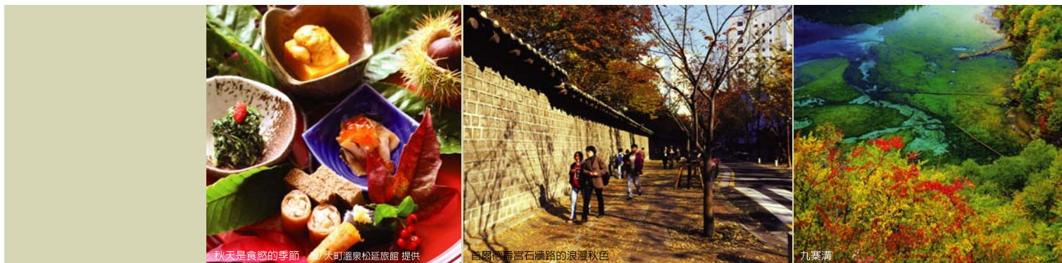
秋天是食慾的季節