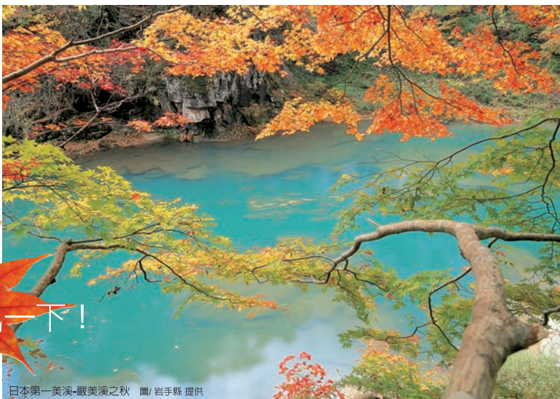
日本第一美溪-嚴美溪之秋