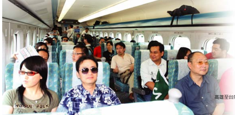
高雄至台南安排舒適快速的高鐵

此外，從高雄左營到台南這一段，則安排了「高鐵」初體驗，不但進站時個個拍照留念，車上新穎舒適的環境，也引起一陣猛拍，抵達台南後，遊覽安平古堡、億載金城、赤崁樓幾