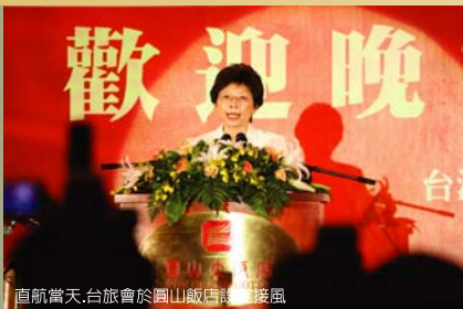
直航當天，台旅會於圓山飯店設宴接風