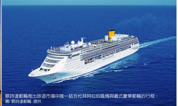
歌詩達郵輪推出旅遊市場中唯一結合杜拜阿拉伯風情與義式豪華郵輪的行程。

個小島，在海上拼繪出一幅世界五大洲，全世界的超級富豪、王室、國際巨星都搶著來買島，房價無限上飆！