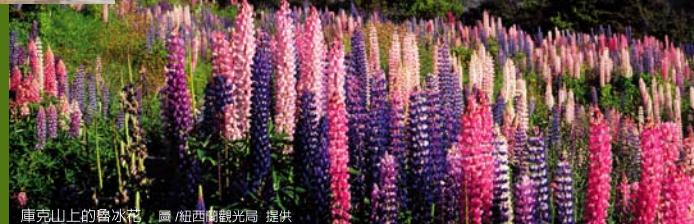
庫克山上的魯冰花

逐 漸春暖的紐西蘭，庫克山是最美的旅遊地，春夏時分特別推出季節限定的「庫克山賞花、遊冰河」的行程，除了深入庫克山外，還在紐西蘭最美的小鎮—皇后鎮住2晚，還搭高山纜車、乘復古蒸汽船，並到零下5度C的冰宮，體驗穿著愛司基摩雪衣喝冰飲料的滋味。另外還在基督城愜意的搭船撐篙遊雅芳河。