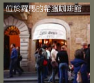
位於羅馬的希臘咖啡館

義大利的魅力，在於每個城市都有不同的風情，至於中古之都比薩，熱力四射的拿坡里，羅密歐與茱麗葉的愛戀之都維洛那；關於中古世紀、文藝復興、巴洛克的歷史風華；還有義大利麵、披薩、咖啡、冰淇淋，這些數不盡的義大利原味，難一語道盡，卻讓人心神嚮往，不論你是否身在義大利，義大利都透過一切事物呼喚著你。