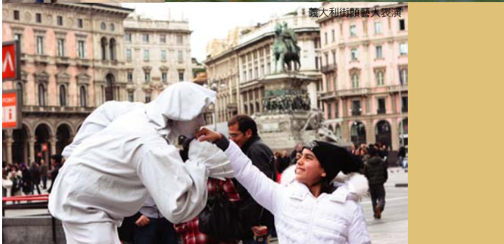
義大利街頭藝人表演