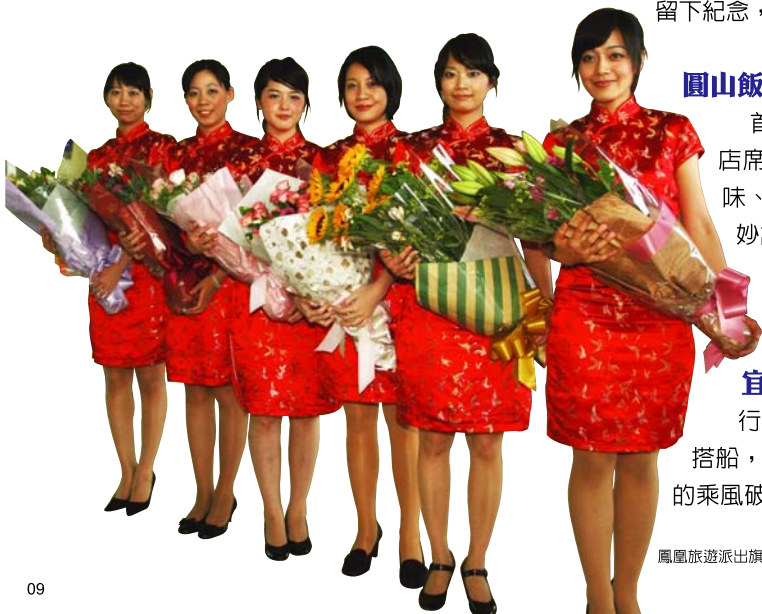
鳳凰旅遊派出旗袍美女團接機

行程由東部展開，穿越壯觀的雪山隧道，抵達宜蘭頭城的烏石港搭船，前往欣賞龜山島風光，並尋找小虎鯨的蹤跡。大約一個半小時的乘風破浪，繞行了龜山島一周，雖然船行的波動與太陽考驗著大家的