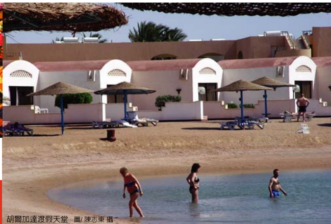
胡爾加達渡假天堂

要 說中國文化博大精深，那麼埃及文化算得上神秘莫測。埃及的傳奇成就了許多膾炙人口的電影題材，「神鬼傳奇一、二集」提供大家一個了解埃及的管道，但是看完後卻也可能產生更多的疑問，神秘的符號、不朽的幾何建築...實在讓人霧裡看花，不過不能否認透過傳媒的影響確實帶動了埃及熱，並且延燒至今。