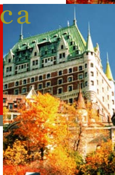
左圖：魁北克芬堤納城堡飯店 上圖：蒙特婁皇家山