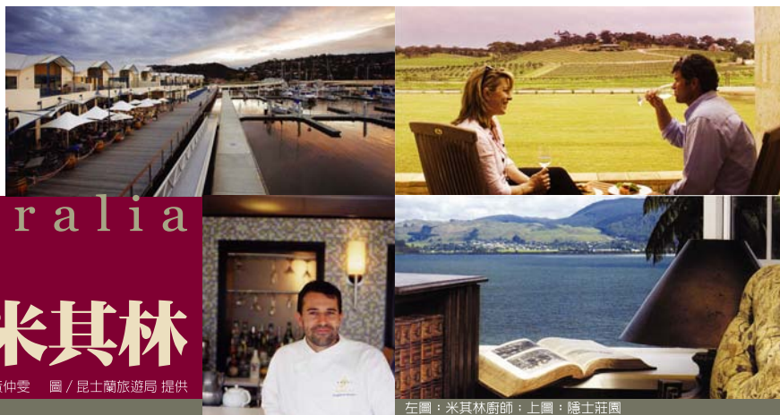
左圖：米其林廚師；上圖：隱士莊園