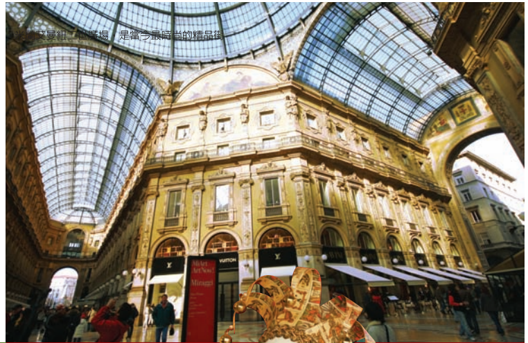
以曼紐二世廣場，是當今最時尚的精品店

有什麼國度會令你魂縈夢牽，只憑她的名字就不由得心神嚮往； 莎士比亞沒到過那裡，卻將「羅密歐與茱麗葉」場景設在維洛那； 莫札特12歲就在羅馬的西斯汀禮拜堂，聽過來自天國的詩歌； 詩人拜倫在威尼斯四處尋歡，靈感大發地寫出著名的詩作「唐璜」； 那裡是宗教的威嚴、時尚的先導、科學的試鍊、藝術的殿堂， 是西方一切文明的源頭，也是所有愛戀的終點； 那裡是義大利，一個令人心神嚮往的國度。