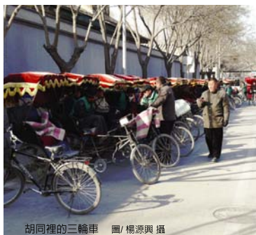
胡同裡的三輪車