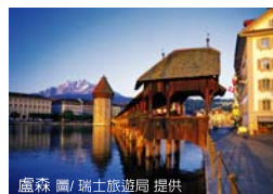
盧森 圖/瑞士旅遊局 提供

要完全體驗阿爾卑斯風情，瑞士絕對是不可或缺的要角，除了少女峰、馬特洪峰、阿萊奇冰河、達沃斯是必遊景點，瑞士的人文風采也是不能忽略的。