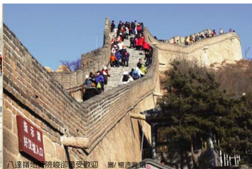
八達嶺地形險峻卻最受歡迎